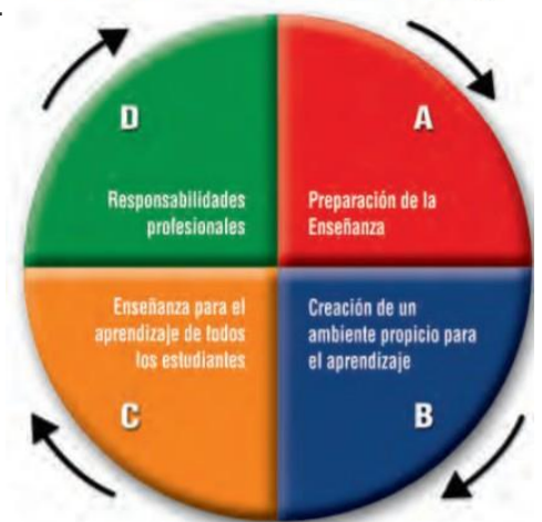
CICLO DEL PROCESO DE ENSEÑANZA-APRENDIZAJE

D.1: El profesor reflexiona sistemáticamente sobre su práctica.